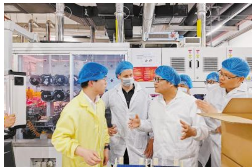
Kiwa 专家组高度评价通威太阳能(合肥)有限公司 ESG 管理

作为通威太阳能(组件)基地的“老兵”,组件合肥基地面对激烈的行业市场竞争,不断练好内功,持续创新,高效经营,在持续发展中焕发新的生机,抵达新的目标,为通威组件业务的快速发展打下了坚实基础。