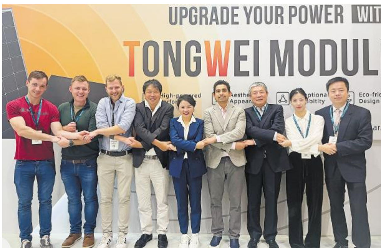
通威与全球伙伴携手追逐绿

2023年是通威分布式业务开展的元年,也是通威组件业务开拓市场的关键一年,多场主场营销活动中,通威与合作伙伴共话行业发展,共谋合作方向,推动形成“你中有我,我中有你”的合作生态,与行业携手共进,合作共赢。