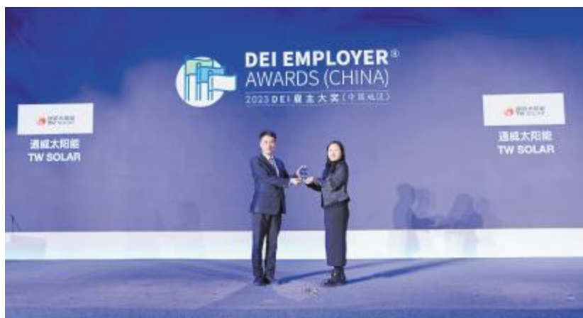
通威太阳能(组件)荣获中国地区首届DEI雇主大奖