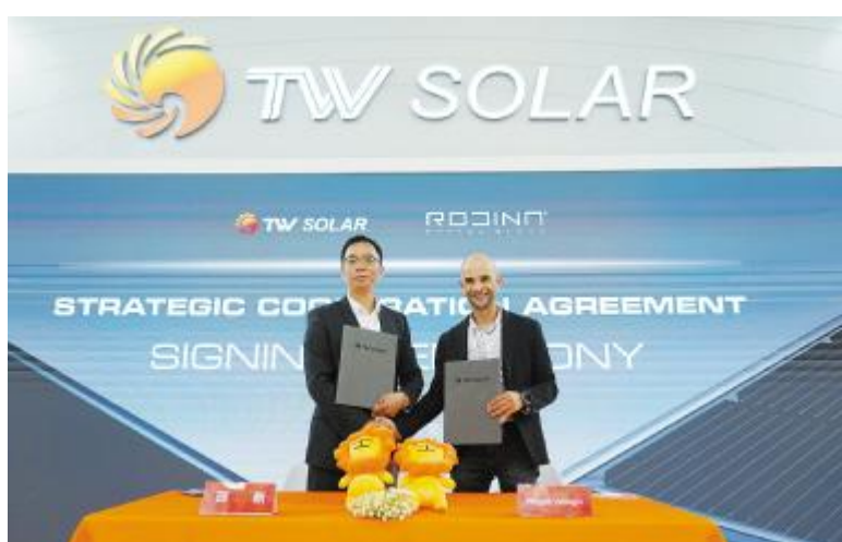
通威与 Rodina 等公司签署战略合作协议