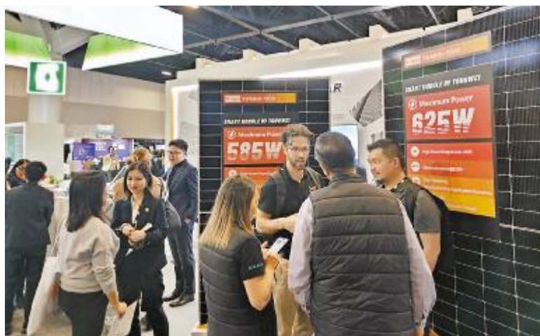
通威高效组件亮相 2023 年澳大利亚电力及新能源展