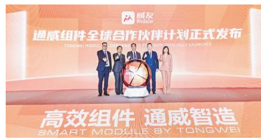
通威组件全球合作伙伴计划正式发布

2023年3月30日,通威太阳能(组件)分布式客户走进通威活动成功举行。来自全国各地的 50 家分布式业务核心企业近百人走进通威,通过实地参观、分享交流等形式,切身感受通威发展