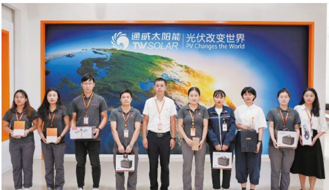
通威太阳能(组件)表彰企业文化之星

开展环保、文化知识竞赛、安全生产、信息安全等文化沙龙主题活动分享互动,参与人次1800人,分享嘉宾53人,满意度98.31%