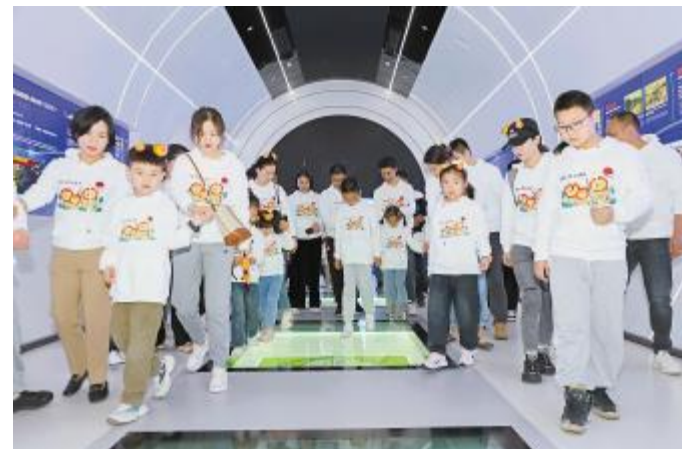
家庭同乐日,通威太阳能(组件)员工家属走进组件盐城基地展厅智能制造体验中心,领略智造魅力