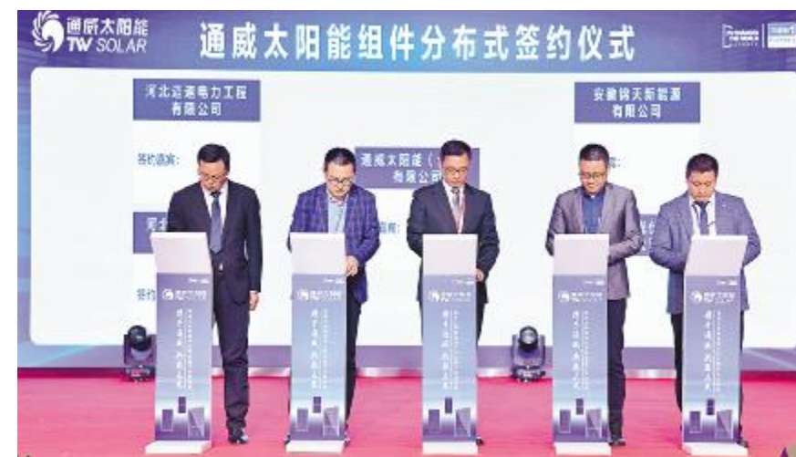
通威太阳能(组件)分布式客户走进通威活动期间,签署组件合作协议

实力。期间,28 家合作企业与通威签署组件合作协议,签约总量超 2950MW,为 2023 年通威组件分布式出货目标及进一步拓展组件下沉市场打下了良好基础。通威太阳能组件分布式客户代表表示,选择与谁同行比要去的远方更重要。从员工认可、行业信誉、发展速度等方面,感受到通威是有光的;从全产业链一体化优势、稳定可靠的质量、及时供货能力、精益生产等方面,证明通威是有实力的;从完整的渠道管理体系、明确的落地方案、完善的渠道商培养体系、基于渠道