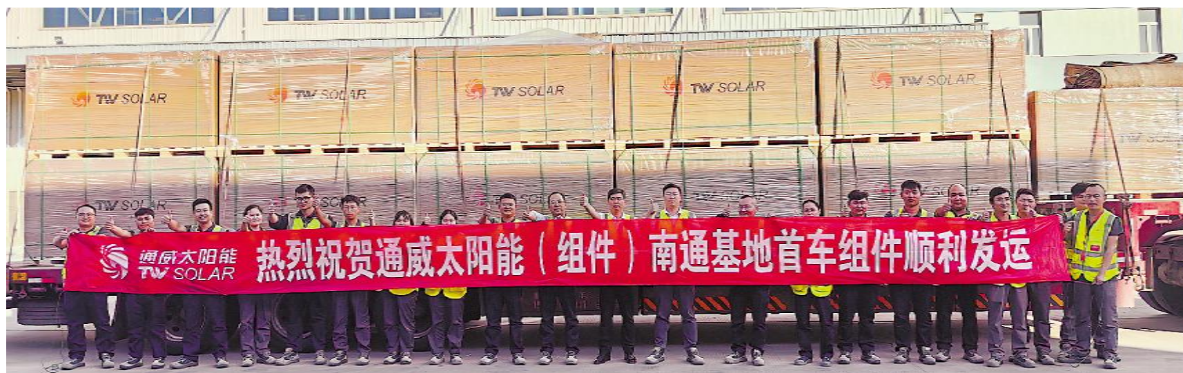
组件南通基地首车组件顺利发运

2023年6月28日,组件盐城基地荣获TüV南德ISO9001质量管理体系认证证书。ISO9001质量管理体系是由国际标准化组织提出、各国企业广泛认可、具有国际权威性和通用性的整体管理体系和标准,可促进企业持续改进产品和过程,实现产品质量的稳定和提高。在国际经济技术合作中,ISO9001标准被作为相互认可的技术基础。获得此项认证标志着组件盐城基地在产品品质、服务水平、环境保护等方面均达到了国际先进水平。以此为契机,组件盐城基地持续加强智能制造建设和创新能力提升,不断提高产品质量和技术水平,推动通威组件事业实现更高质量发展。