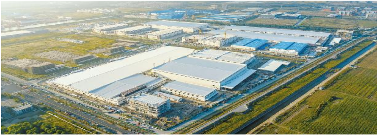
通威太阳能(组件)南通基地