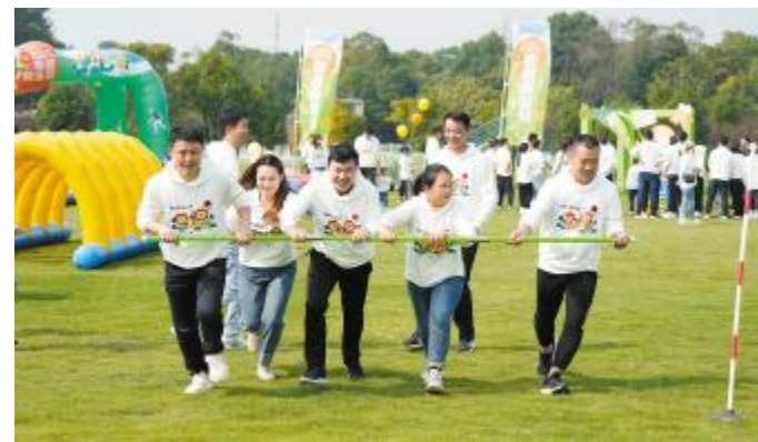
家庭同乐日,通威太阳能(组件)员工家属亲密互动