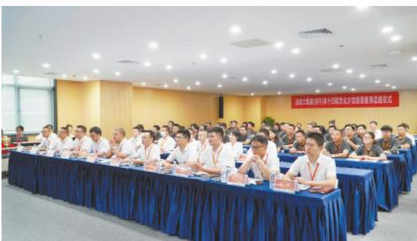
通威太阳能(组件)开展第十四期文化沙龙