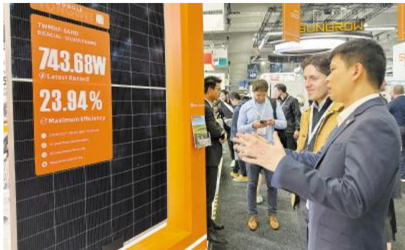
通威高效组件亮相国际展会

大核心竞争力之一,并全面布局光伏主流技术,除HJT、TOPCon技术外,还在XBC、钙钛矿/硅叠层等技术领域深入探索与实践。这种多元化技术布局使通威在应对光伏市场变化时更