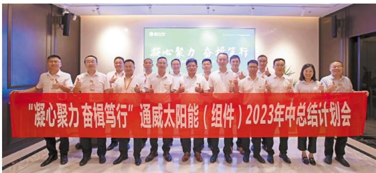
通威太阳能(组件)召开2023年中总结计划会

当前,通威太阳能(组件)合肥、盐城、金堂、南通基地安全高效运行,助力通威形成更具市场竞争力的光伏产业结构,进一步夯实领先地位,有助于推动中国光伏产业的发展和碳中和目标的实现。通威将以具有全球竞争力的强劲实力为牵引,继续引领光伏产业不断向前,开创绿色发展新蓝图。