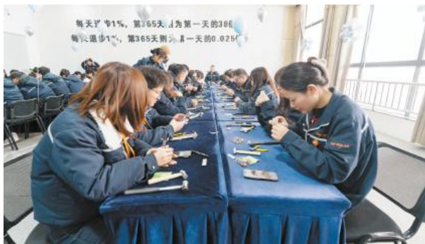
通威太阳能(组件)合肥基地举行第四季度员工生日会