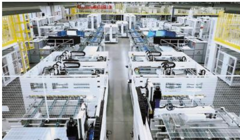
通威高效组件智能制造生产线