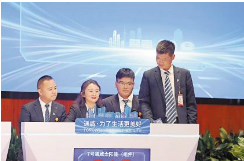
通威太阳能(组件)选手参加通威集团41周年庆暨2023年企业文化与党建知识竞赛总决赛

对启航生来说,新的征程已经开启。通威太阳能(组件)人力体系根据完善的培养与带教计划,采取线上与线下相结合、学习与实操并进的方式,帮助启航生们完成从校园到职场的转变,快速成为技术骨干,为公司发展提供坚实的人才储备,助力组件事业的快速发展。