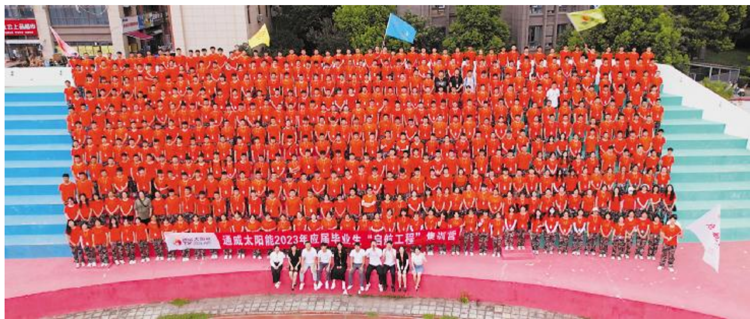
通威太阳能(组件)2023届启航工程集训营圆满结营